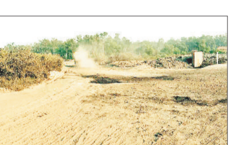
माउंटन मशीन की मदद से फलाई ऐश राखड़ को ट्रकों में लोड कर ईट उद्योग संचालकों और पास में बन रहे ओवरब्रिज के ठेकेदार को बेच दे रहे हैं।

बिश्रामपुर। एसईसीएल विश्रामपुर क्षेत्र के बंद पड़े ओसीएम खदान से अब फलाई ऐश यानि राखड़ चोरी का मामला सामने आया है, जानकारी के अनुसार खदान में कोयला उत्पादन बंद होने के बाद पाँच व ल प्लांटों से निकले फलाई ऐश की भराई का कार्य करीब एक वर्ष तक चला, हाल ही में क्वारी नंबर-1 में लगभग 13 लाख क्यूबिक मीटर राखड़ भराई पूरी होने के बाद फिलिंग कार्य को बंद कर दिया गया, जिसके बाद अब डंप राखड़ की चोरी शुरू हो गई है, बताया गया कि पिछले डेढ़-दो माह से कुछ स्थानीय युवक एक गिरोह बनाकर रात और दिन के समय डोजर और चैन