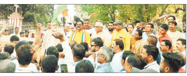
प्रदर्शन करते कांग्रेसी।